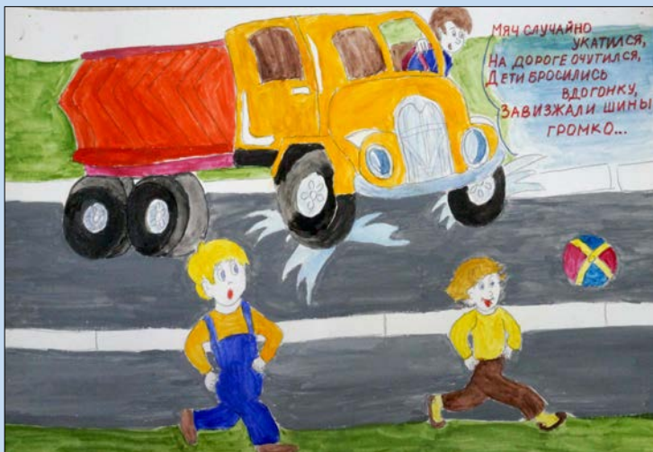
Рисунок Артёма Куликова, 1В